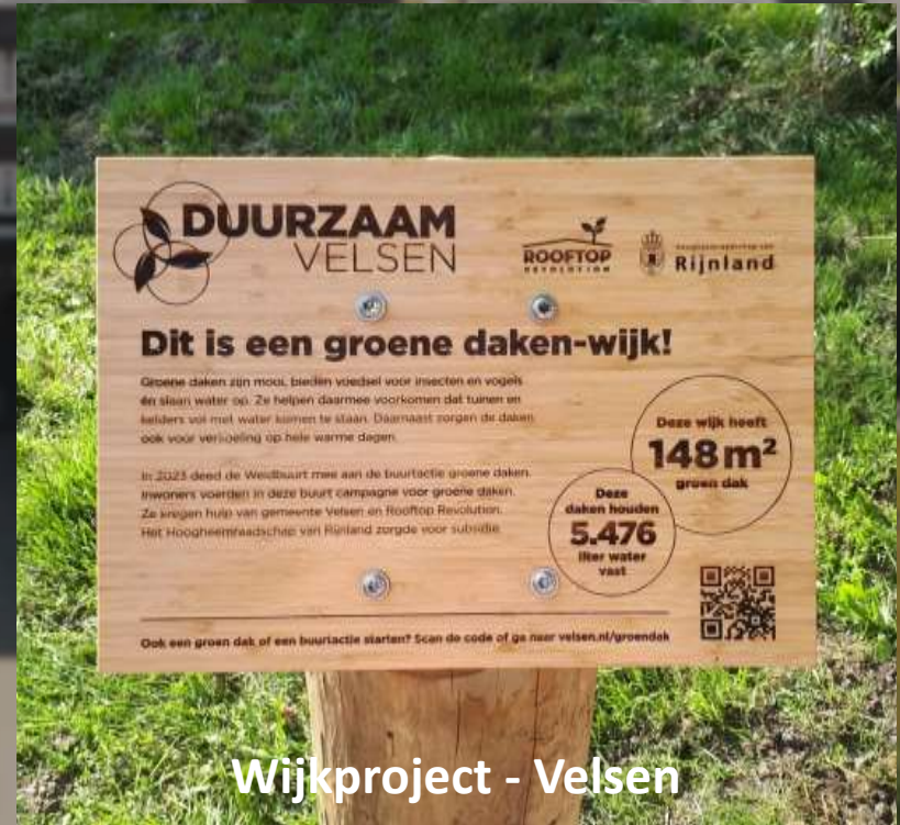
Wijkproject - Velsen