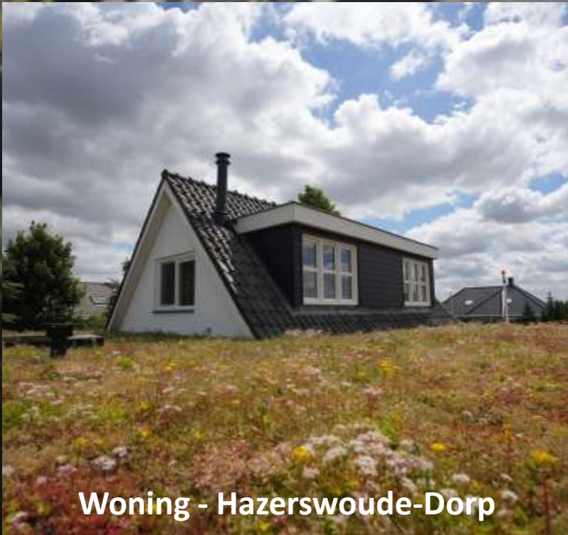
Woning - Hazerswoude-Dorp