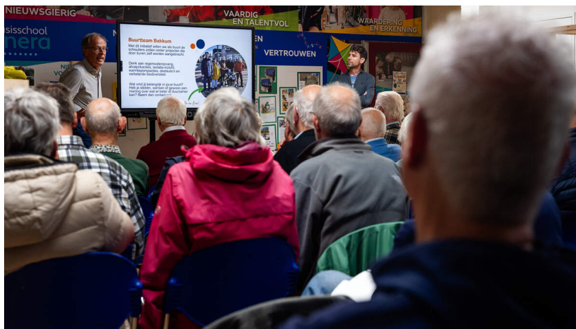
Beangstellenden bij de informatieavond over warmtepompen in Bakkum.

BAKKUM Wil Bakkum aan de warmtepomp en wat zijn de mogelijkheden? Op de informatiemarkt in basisschool Cunera kwamen ruim vijftig belangstellenden af. Een bezitter van een warmtepomp,